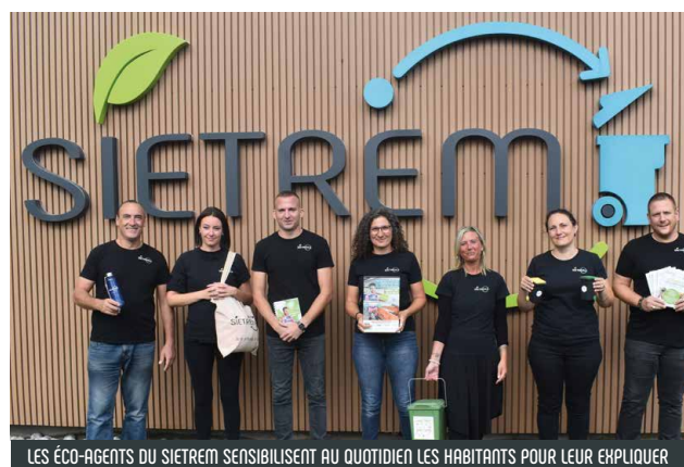
LES ÉCO-AGENTS DU SIETREM SENSIBILISENT AU QUOTIDIEN LES HABITANTS POUR LEUR EXPLIQUER COMMENT BIEN GÉRER LEURS DÉCHETS