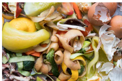
Déploiement des dispositifs de tri des biodéchets - P. 8