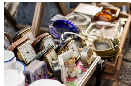
Zoom sur la ressourcerie de Torcy - P. 11