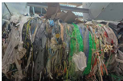
Stop aux erreurs de tri - P. 4/5