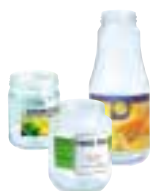
Bocaux de conserve